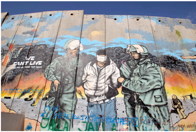
Murals a la Paret de la Segregació que envolta la ciutat de Betlem.