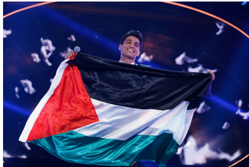
Mohammed Assaf alçant la bandera palestina durant la seva participació a Arab Idol.

cantar en casaments de la seva comunitat a guanyar el concurs internacional Arab Idol. El seu èxit és un acte de resistència en si mateix i parla de com el llegat palestí no pot ser esborrat. Assaf explica que no pot diferenciar entre el seu art i la seva actitud patriòtica. Vivint sota ocupació, realitzar art sense matisos polítics resulta gairebé impossible. Amb les seves senzilles frases transmet l'amor dels palestins per la seva terra natal i la seva identitat àrab.