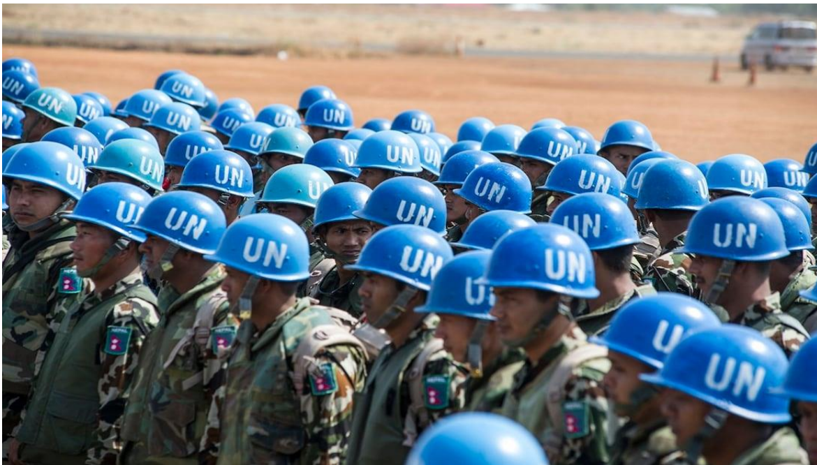
Imatge 2. Cascos blaus de Nacions Unides.

L'actuació d'aquesta OMP resta necessària per tenir una força imparcial que informi el Consell de Seguretat sobre les violacions del dret internacional humanitari; no només contra població civil sinó també contra els cascos blaus,