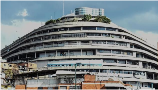
El Helicoide

Si hay una estructura que representa la constante represión ejercida por las autoridades venezolanas es el Helicoide. Aunque hoy es una de las sedes del Servicio Bolivariano de Inteligencia Nacional, originalmente no estaba destinado a fines políticos. Durante el boom económico de los 50s, el presidente Marcos Pérez Jiménez comenzó con su construcción bajo la idea de un centro comercial futurista que representaría el crecimiento de una Caracas