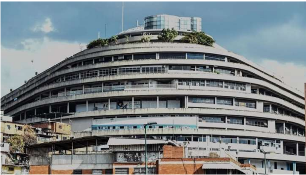
El Helicoide

Si hi ha una estructura que representa la constant repressió exercida per les autoritats veneçolanes és l'Helicoide. Encara que avui és una de les seus del Servei Bolivarià d'Intel·ligència Nacional, originalment no estava destinat a fins polítics. Durant el boom econòmic dels 50s, el president Marcos Pérez Jiménez va començar amb la seva construcció sota la idea d'un centre comercial futurista que representaria el creixement d'una Caracas ultramoderna. No obstant això, després de la recessió econòmica que va travessar el país en els anys es va detenir la seva construcció.