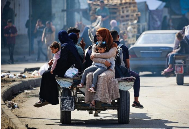
Palestins desplaçats surten de la ciutat de Rafah.

Primer de tot, hem d'atendre el fet que tots els palestins del pas de Rafah es troben en una situació d'extrema vulnerabilitat, i se'ls ha impedit a qualsevol possibilitat d'abandonar el territori de conflicte de Gaza. L'atac militar israelià ha resultat en nombroses víctimes civils, a més d'haver causat la destrucció addicional dels escassos serveis i infraestructures que encara quedaven operatives i eren vitals per a la supervivència de la població.