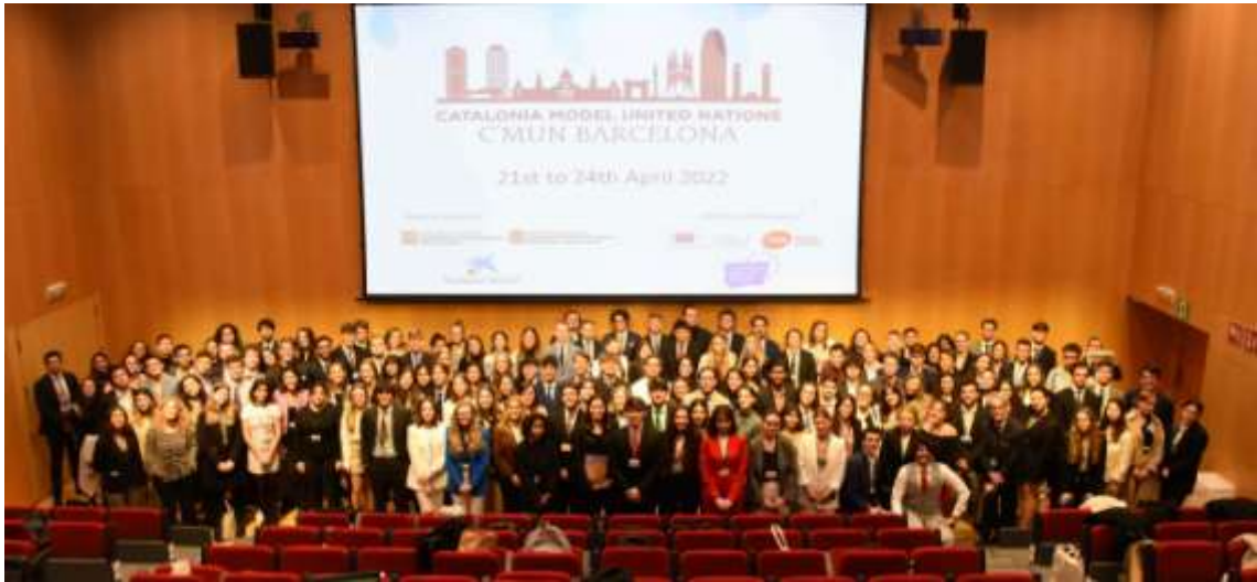
Sessió de cloenda del C'MUN 2022 a Cosmo Caixa