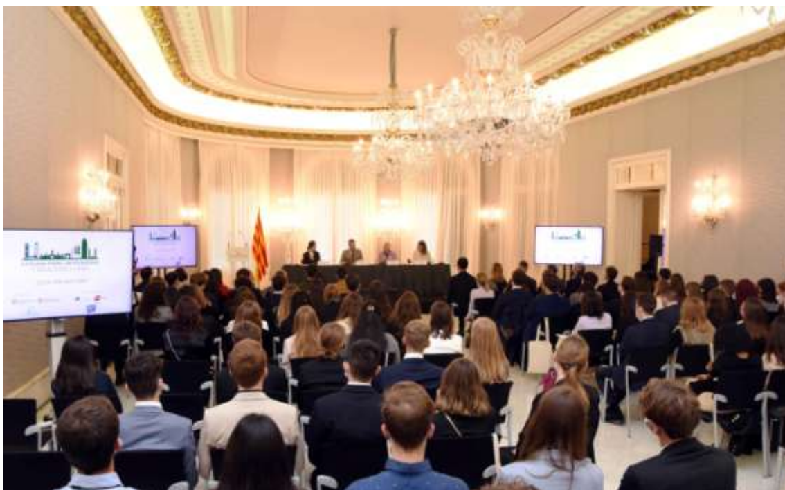
Sessió d'inauguració del C'MUN 2022 al Palau de Pedralbes de Barcelona

participants en una emotiva fotografia. Com és sabut, C'MUN Barcelona és un dels fòrums internacionals més importants de simulació del funcionament de les Nacions Unides d'aquestes característiques que se celebren arreu. Des del seu inici ha comptat amb el suport de la Generalitat de Catalunya.