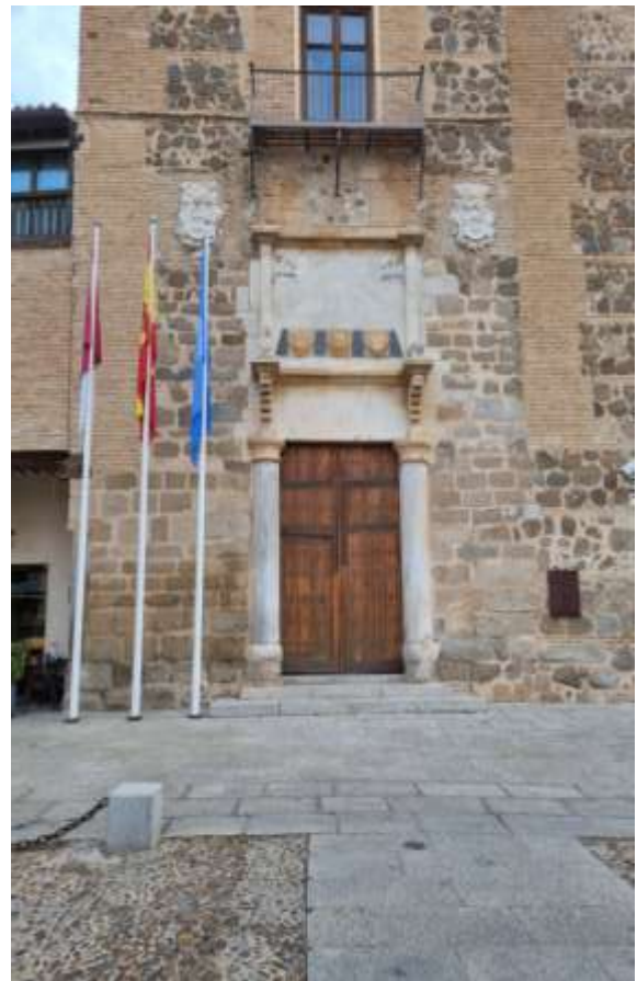
Junta de Castilla-La Mancha