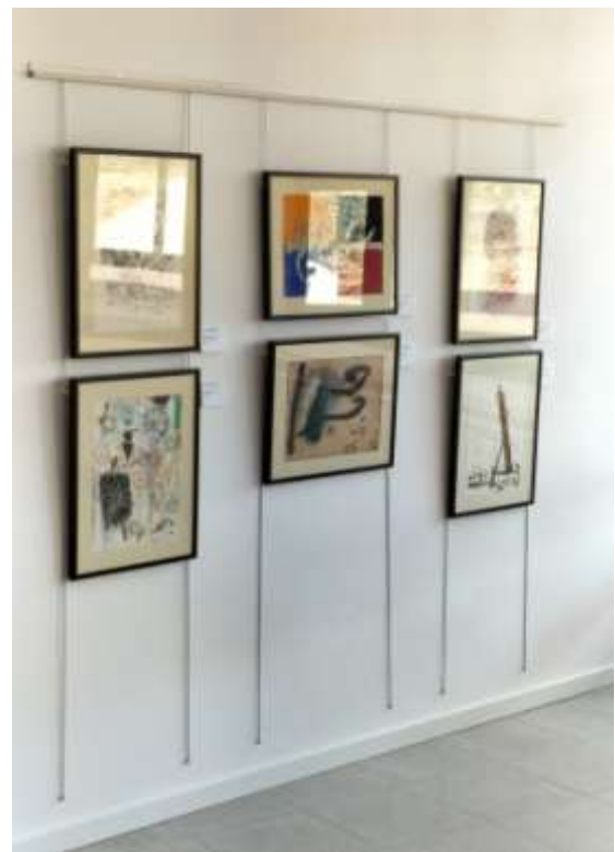
L'exposició a Ulldemolins, Tarragona