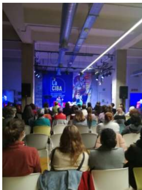
Conferència a Santa Coloma de Gramenet amb l'escriptora i activista afganesa Nadia Gulham.