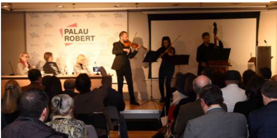
Cloenda de l'acte Amb l'actuació del grup musical Filarmònica Popular