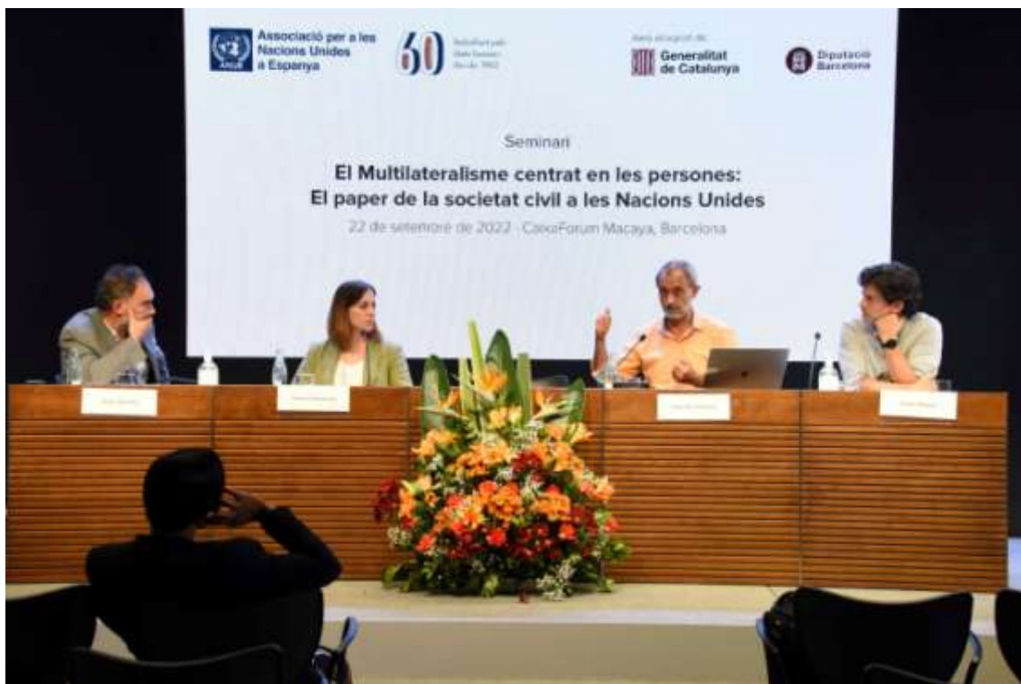
Taula rodona “Mobilització dels agents socials en el foment dels Objectius de Desenvolupament Sostenible”

Finalment, els assistents van poder gaudir d'una exhibició commemorativa sobre els seixanta anys de treball d'ANUE pels drets humans.