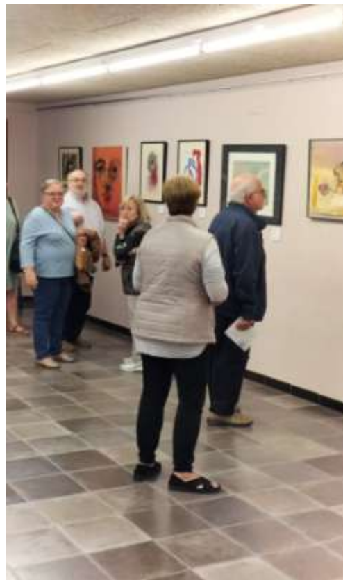
L'exposició a Padradell de la Teixeta, Tarragona