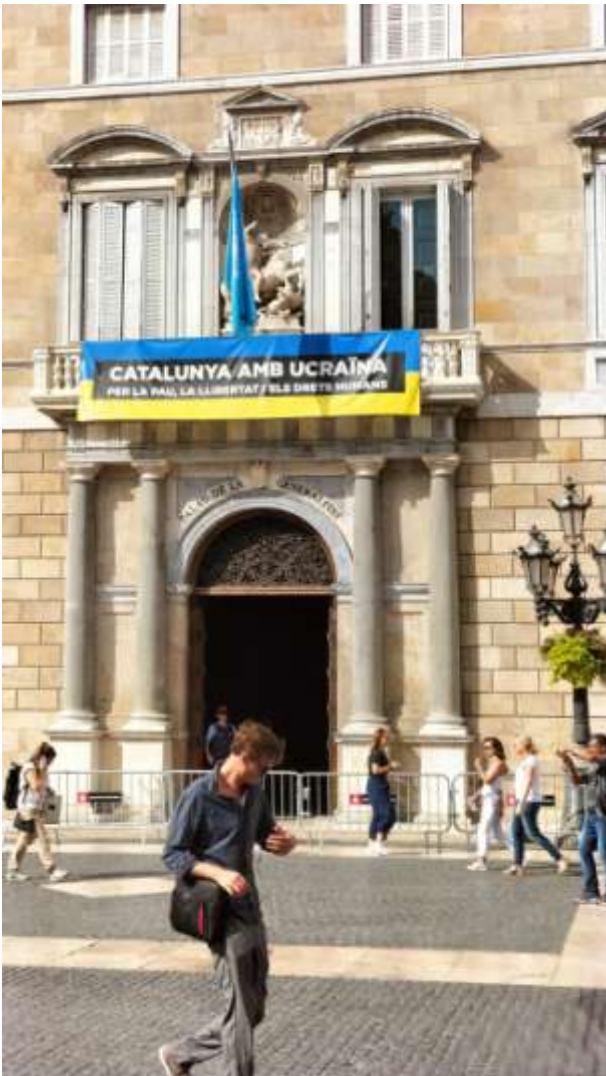
Palau de la Generalitat de Catalunya

Desde el año 2009, ANUE lanza una campaña el 24 de octubre con motivo del día de las Naciones Unidas pidiendo a los ayuntamientos y las Instituciones del Estado ondeen la bandera de la ONU. Por tanto, queremos agradecer este año la participación de la Generalidad de Cataluña, al Gobierno Vasco, y a la Comunidad de Madrid, los Parlamentos de Canarias, Cataluña, Navarra y la Mesa de Cortes de Aragón así como los ayuntamientos de Castelldefels, Santander, Teruel, Sant Feliu de Llobregat, Barcelona, Lleida, Cádiz, Lugo, Zaragoza, Sevilla, Girona y Córdoba para conmemorar las Naciones Unidas y transmitir los valores y la misión de la Organización.