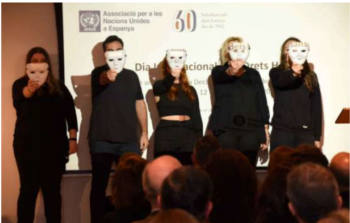
Un grup d'alumnes de la companyia de teatre Comediarte va escenificar un dels articles de la Declaració Universal dels Drets Humans