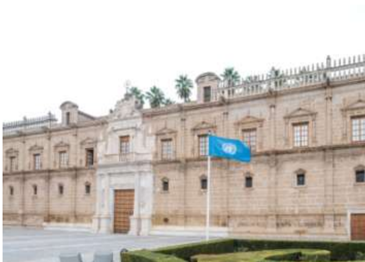
Junta de Andalucía