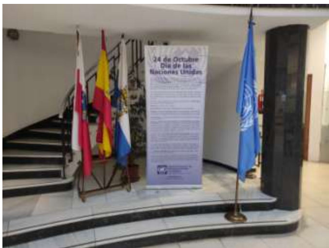
Ajuntament de Santander