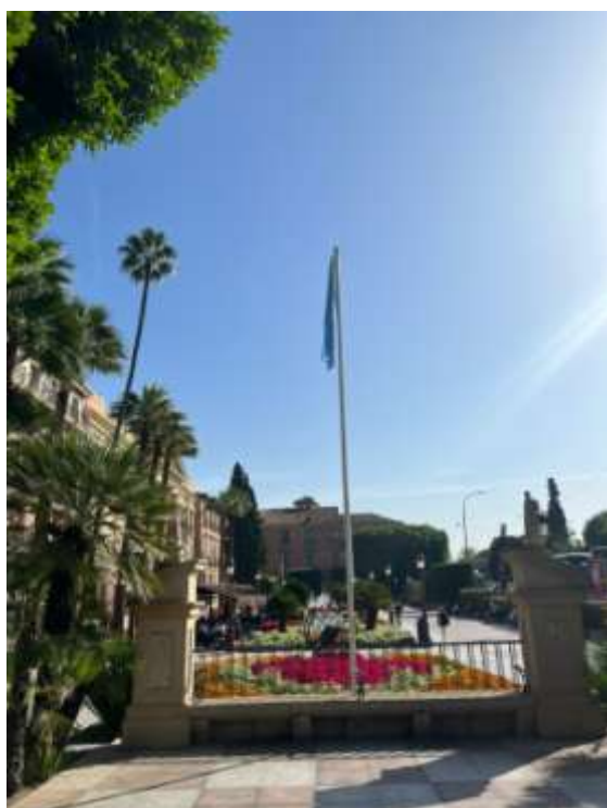
Ajuntament de Murcia