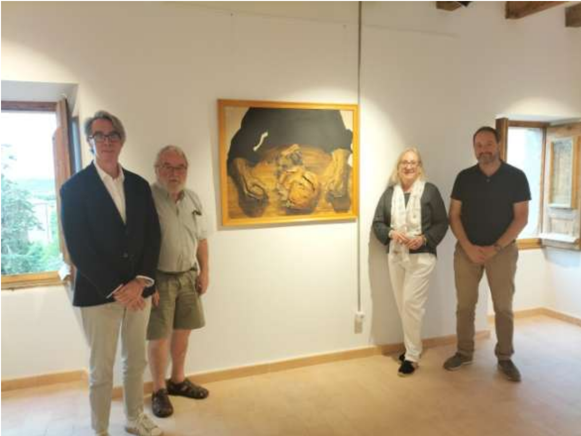
L'exposició al Monastir del Miracle de Riner