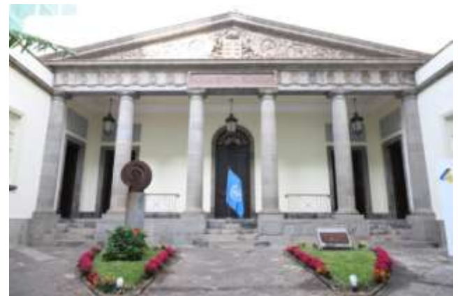
Parlamento de Canarias