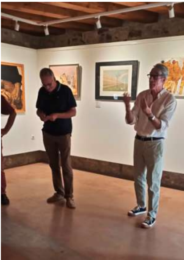
L'exposició a Torerbesses, Lleida