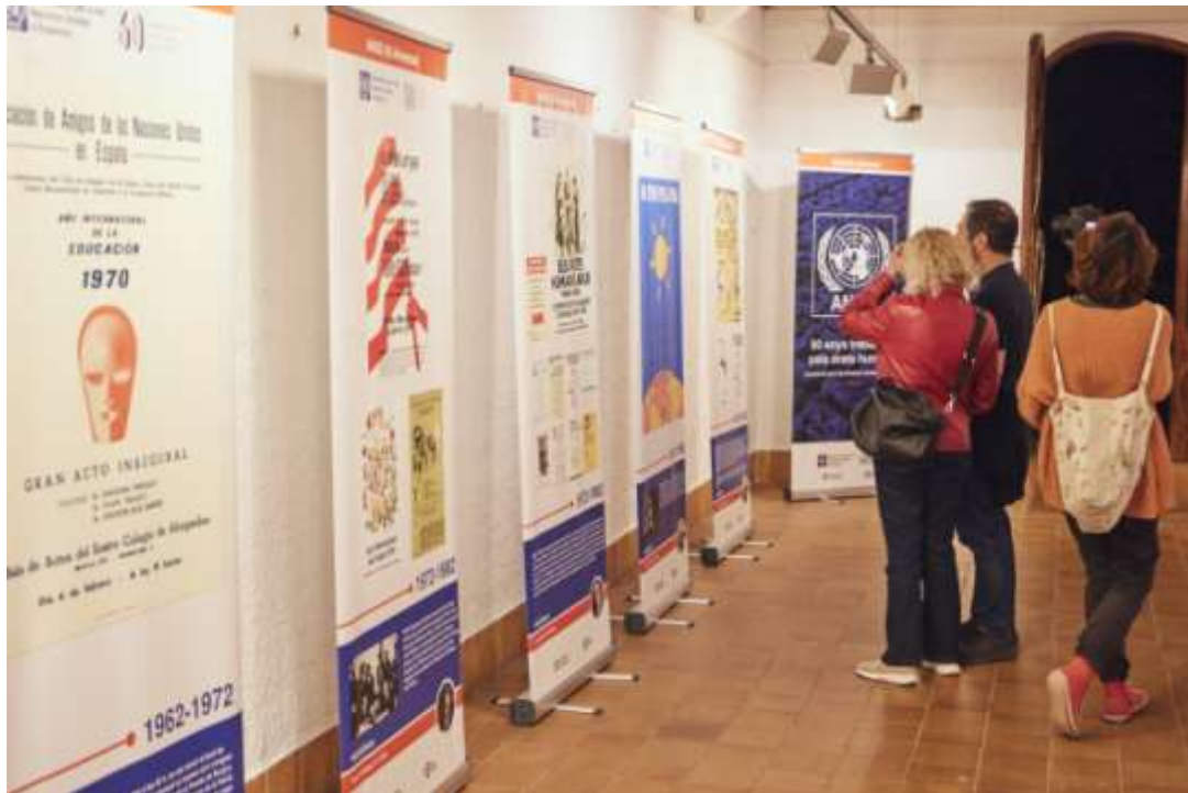
L'acte es va celebrar al Casal de Cultura Robert Brillas