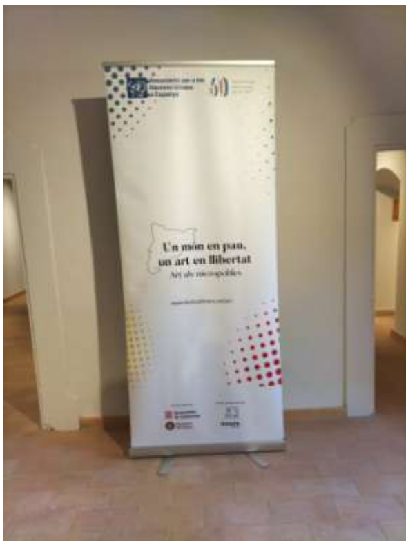
Plafó d'anunci de l'exposició