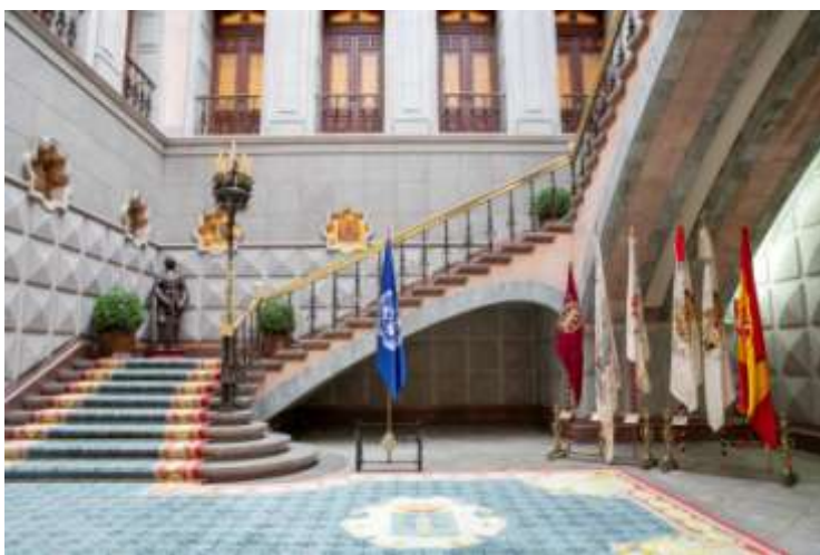
Ajuntament de La Coruña