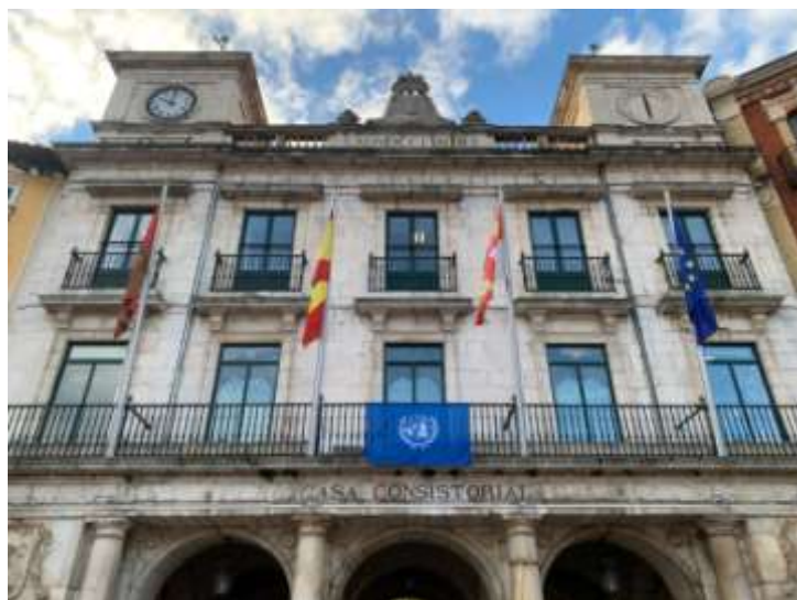
Ajuntament de Burgos