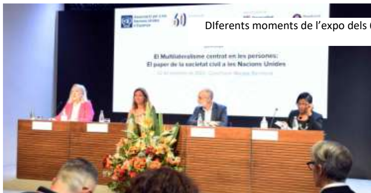
Diferents moments de l'expo dels 60 anys d'història d'ANUE