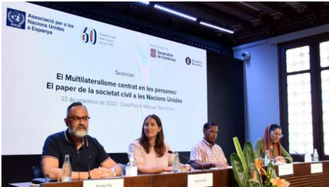
Taula rodona “La visió global de la societat civil en l'àmbit dels drts humans”