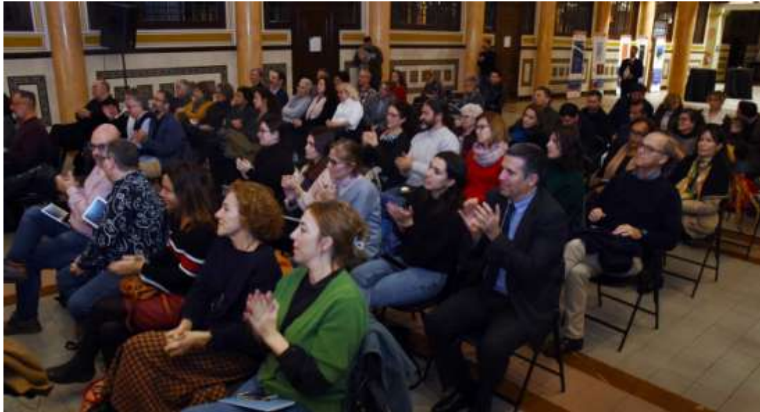
Exposició dels 60 anys de l'ANUE a la sala de la cerimònia de lliurament del Premi per la Pau 2023