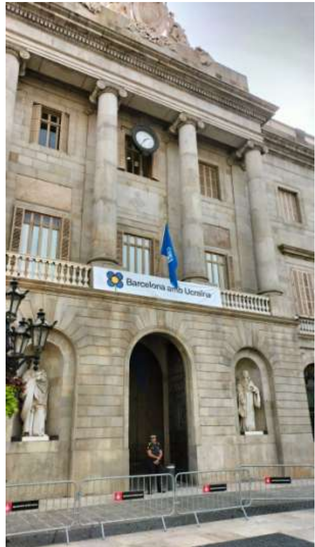
Ajuntament de Barcelona