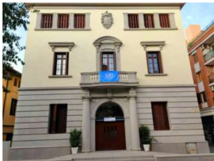
Ajuntament de Sant Feliu de Llobregat