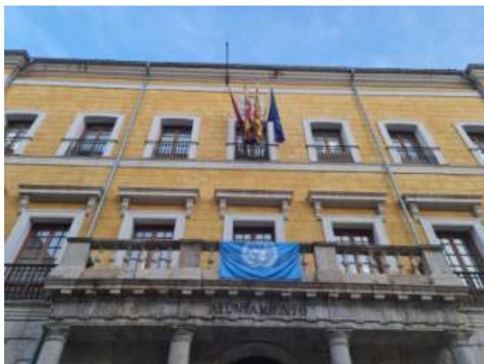
Ajuntament de Teruel