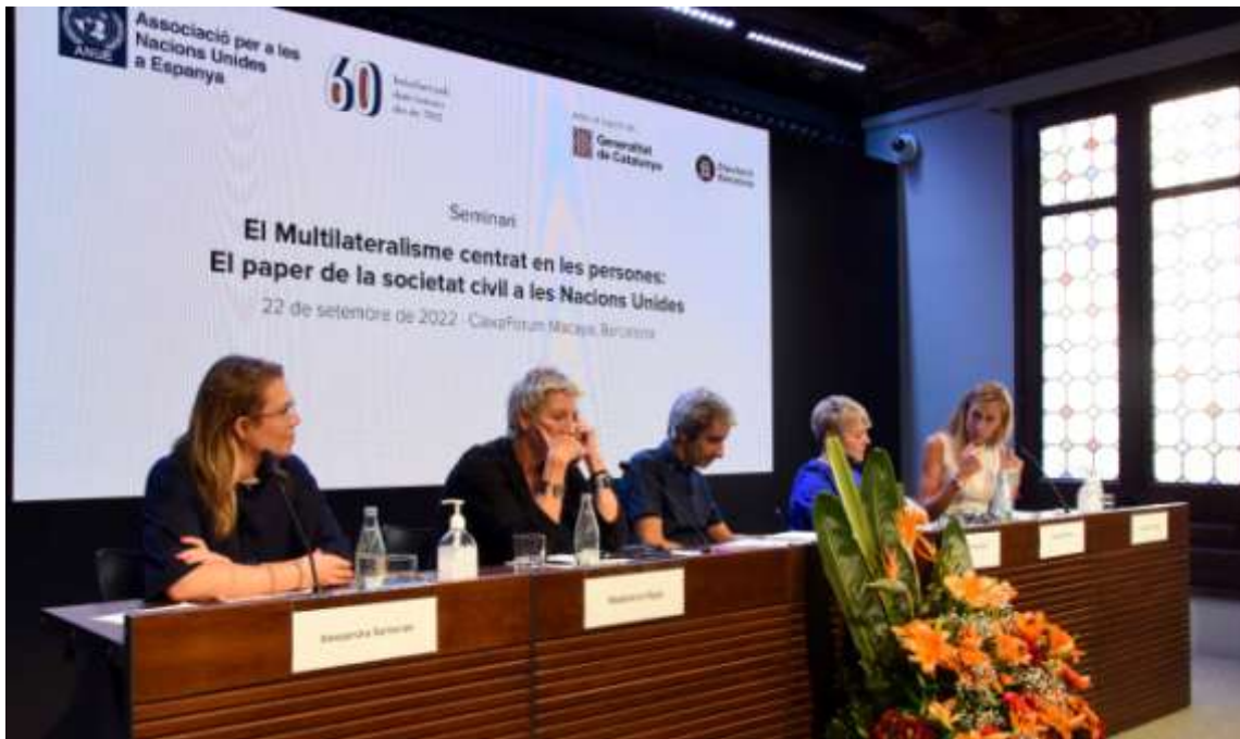
Taula rodona “El paper de la societat civil en la consolidació de la pau i la seguretat internacionals”