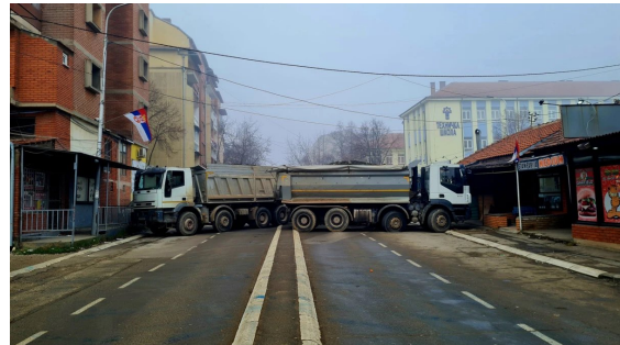
Barricades sèrbies al nord de Kosovo.

Tant la nova obligatorietat de matricular els vehicles com l'adquisició prescriptiva de la documentació temporal, van rebre una forta oposició pels ciutadans serbokosovars, que van sortir al carrer i van protagonitzar diverses manifestacions, algunes de violentes, contra les forces de seguretat de Kosovo. A més, els opositors a la reforma van bloquejar els passos interfronterers, que més tard van ser tancats temporalment per les autoritats kosovars.