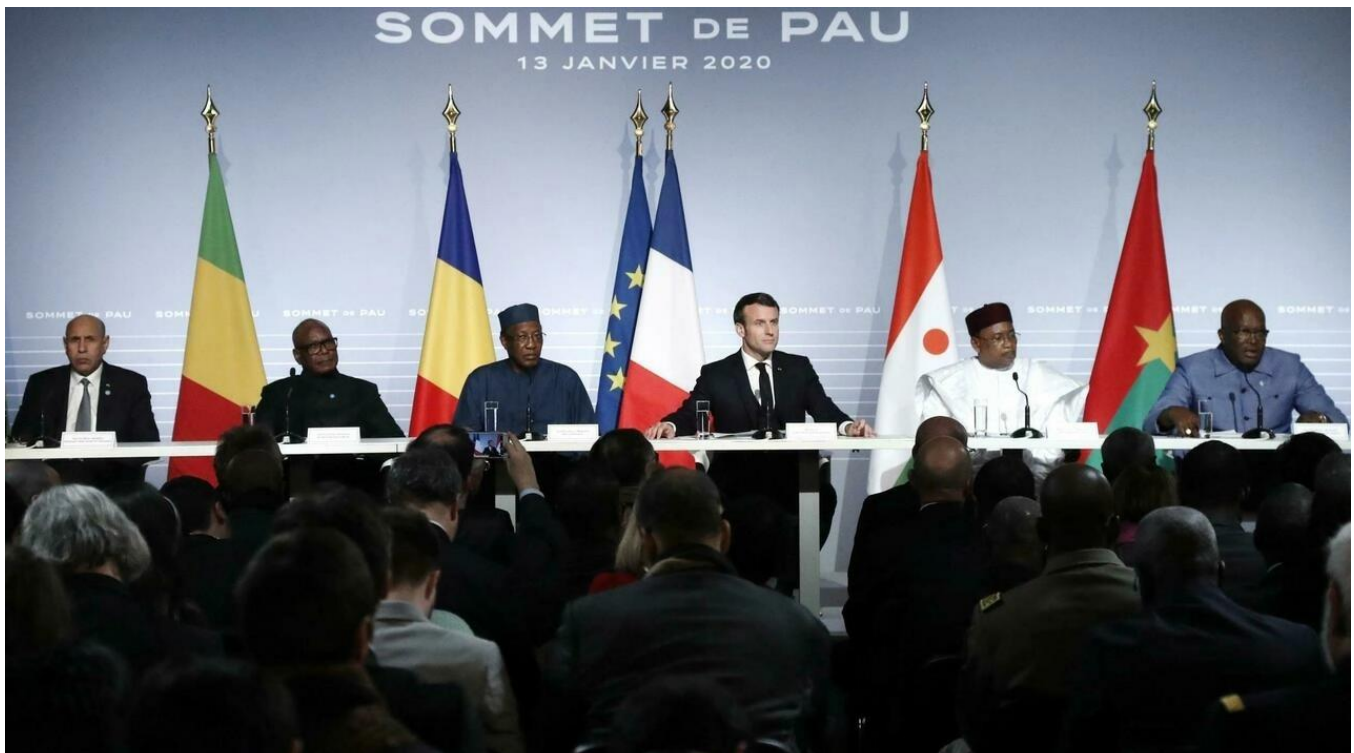
Francia y los países del G5 Sahel reunidos en una cumbre de paz en enero de 2020

La comunitat internacional ens ha donat una valuosíssima lliçó de solidaritat i esperança amb la